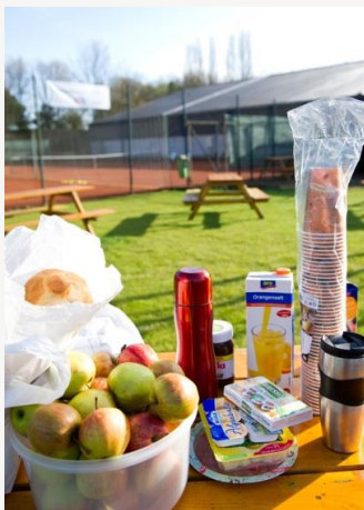
Morgens gibt es auf der Turnieranlage ein gesundes Frühstück, mittags ein warmes Buffet.