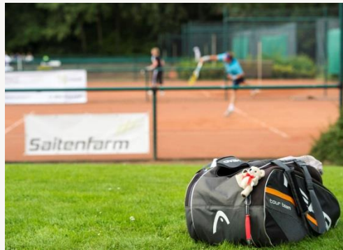
Das Turnier-Konzept: spannende Spiele in entspannter Atmosphäre.